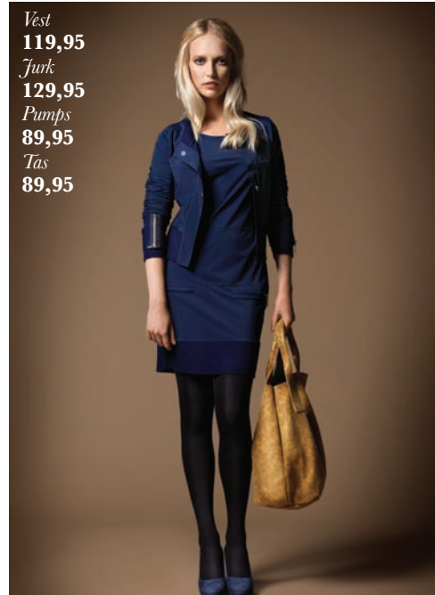
Vest 119,95 Jurk 129,95 Pumps 89,95 Tas 89,95