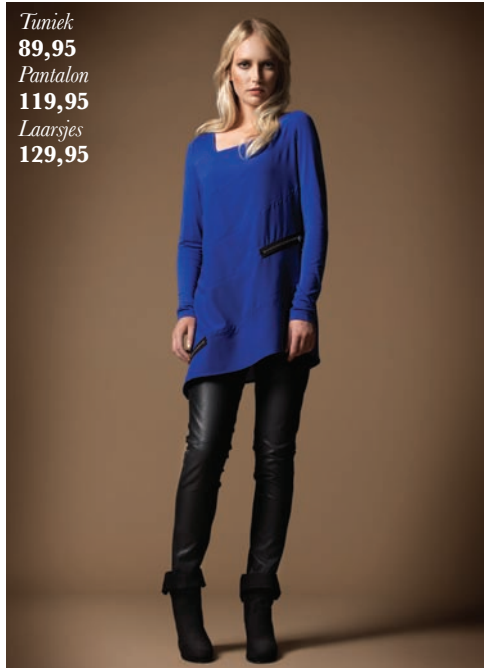
Tuniek 89,95 Pantalon 119,95 Laarsjes 129,95