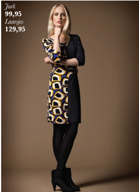
Jurk 99,95 Laarsjes 129,95