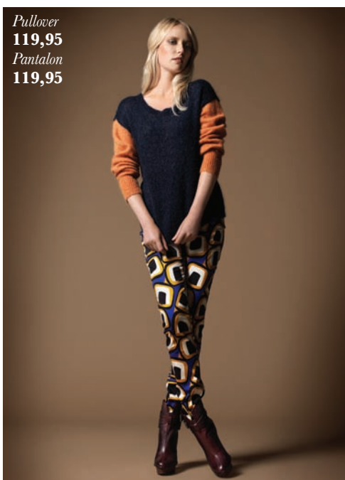
Pullover 119,95 Pantalon 119,95