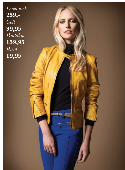
Leren jack 259,- Coll 39,95 Pantalon 159,95 Riem 19,95